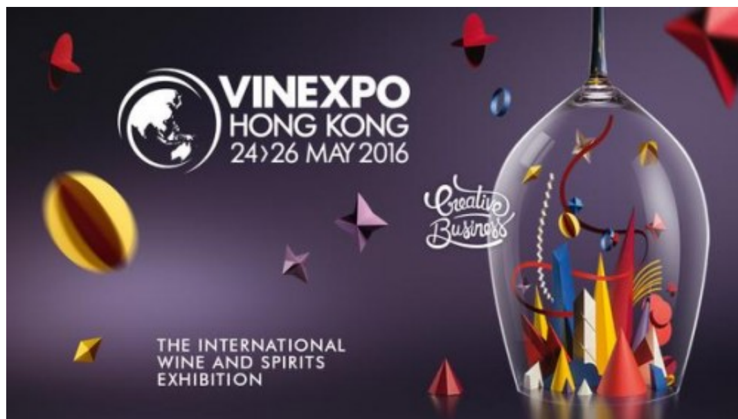
Vinexpo Hong Kong

L'Italia del vino, per tre giorni, guarda ad Oriente. Dal 24 al 26 maggio più di 250 tra aziende e consorzi, dal Piemonte alla Sicilia, trasferiscono bottiglie e sommelier a Hong Kong, la più grande fiera del settore in quella parte del mondo (la cadenza è biennale, negli anni dispari la stessa società organizza Vinexpo a Bordeaux).